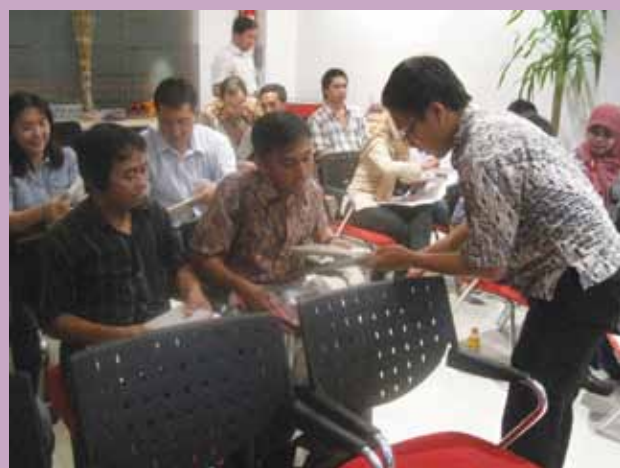
PT Arsindo, PT Etika Prana, dan PT Duticon

Gathering ini diisi dengan paparan mengenai product knowledge Tile GRANITO yang langsung diikuti dengan sesi tanya jawab. Banyak sekali pertanyaan dari para konsultan ini, terkait dengan masalah-masalah yang sering terjadi di proyek. Diskusi pun berlangsung dengan serius. Tim GTS juga mengajak para konsultan melihat-lihat fasilitas yang ada di GTS Surabaya. Acara ditutup dengan makan bersama, karaoke, dan pembagian doorprize.