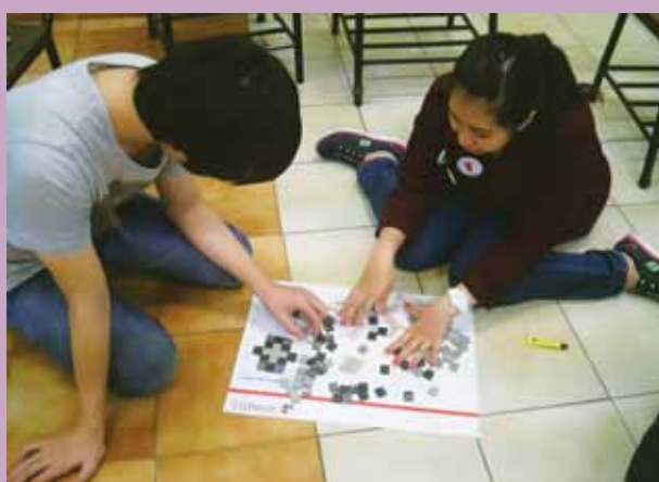
Lomba Mosaic di Universitas Bina Nusantara Jakarta.

GRANITO bekerja sama dengan beberapa institusi pendidikan untuk mengadakan lomba menyusun Tile Mosaic. Kali ini giliran mahasiswa dari Lasalle College (Surabaya) dan Bina Nusantara (Jakarta) yang bisa mengikuti lomba. Di Surabaya, acara digelar di Atrium Ciputra World, Maret 2013. Sedangkan di Jakarta, lomba berlangsung di kampus Binus, menjadi bagian dari Pameran Eco Design. Sebelum lomba ada presentasi product Knowledge. Beragam desain dihasilkan oleh para mahasiswa ini, mereka yang terbaik mendapat hadiah berupa buku interior yang bisa dipakai untuk belajar.