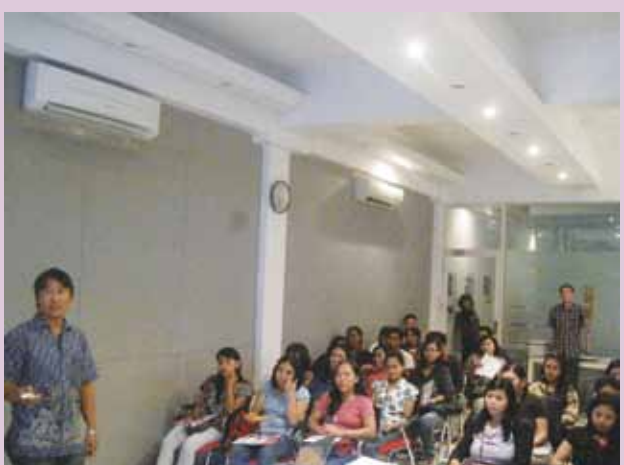
Gathering Sales Counter toko tahap kedua berlanjut di bulan Maret 2013, jumlah pesertanya semakin banyak.