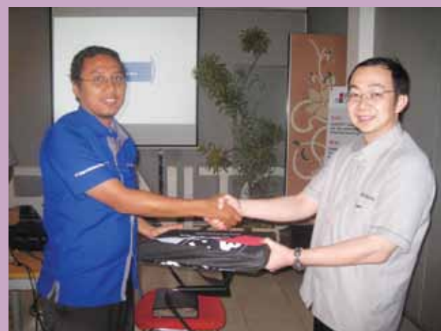
PT Wijaya Karya Kontraktor, PT Integre Maha Karya Estetika, Pentagraha Matra Persada