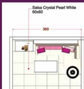
Denah ruang keluarga

Mosaic Maroko merupakan Tile yang memiliki motif-motif etnik khas gaya Maroko. Mosaic biasa diletakkan sebagai aksen dalam ruang, berpadu dengan body Tile polos. Tapi, Mosaic bisa juga diletakkan di permukaan dinding, seperti desain Ruang Keluarga di samping.