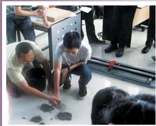
Training aplikasi cara memasang Tile yang benar.

Februari lalu, 26 mahasiswa Desain Interior Universitas Ciputra Surabaya mengikuti kuliah tamu yang diisi oleh GRANITO. Mahasiswa tampak antusias mengikuti perkuliahan karena materi yang diberikan berbeda dengan yang biasa didapat di kelas. Apalagi pada saat training aplikasi, mahasiswa bergantian mencoba alat pemotong Tile dan penasaran ingin tahu cara mengaduk semen yang benar.