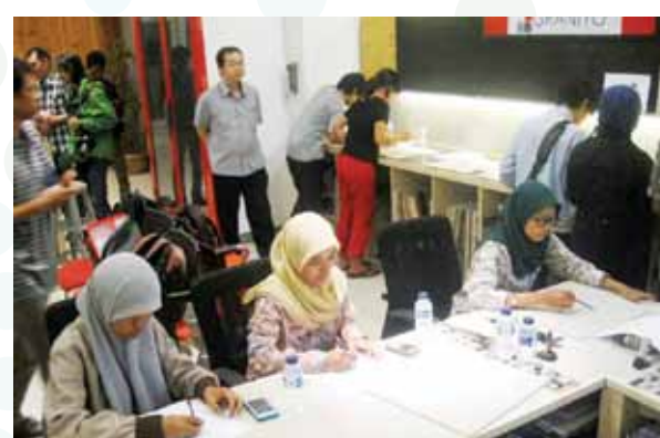
Lomba Comic on Tile, bagian dari acara Cergamboree 2013.