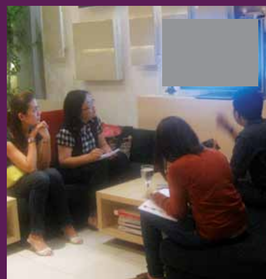
Dosen dan mahasiswa Lasalle College Surabaya menyimak product knowledge.