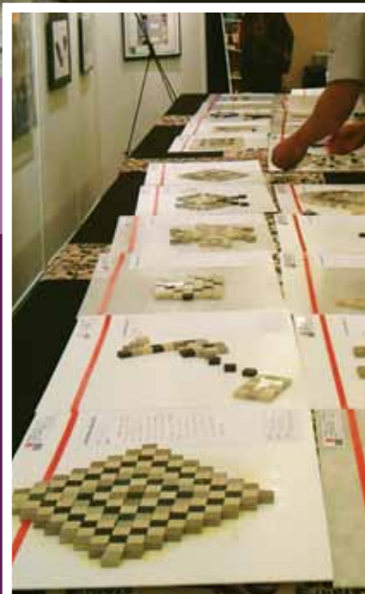
Hasil karya para peserta lomba menyusun Tile Mosaic GRANITO.