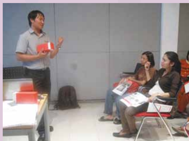
Gathering Sales Counter toko, Februari 2013, rekan sales counter diundang ke GTS Surabaya.