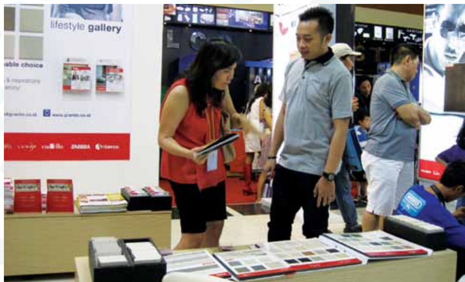
Suasana stand GRANITO saat pameran Indobuildtech 2013, pengunjung membanjiri stand (foto atas dan kiri). Salah seorang pengunjung sedang mengikuti lomba menyusun Tile (foto paling kiri).