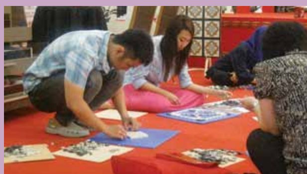
Lomba Mosaic di Atrium Ciputra Surabaya, diikuti oleh mahasiswa dari Lasalle College Surabaya.