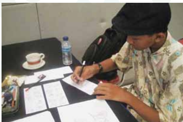
Workshop komik diikuti oleh 16 peserta.