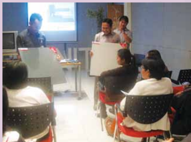
Peserta Gathering diperkenalkan pada Tile terbaru GRANITO dari dekat. Rekan-rekan sales counter bisa melihat langsung warna dan motif Tile-Tile terbaru.