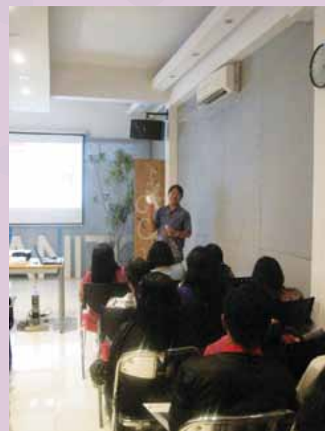
Rekan sales counter diingatkan kembali produk-produk Tile GRANITO melalui presentasi product knowledge.