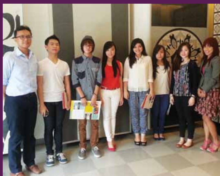
Lasalle College Jakarta saat mengunjungi GTS Panglima Polim.

GRANITO Tile Studio merupakan tempat para desainer, di sini pekerja desain maupun seniman bisa belajar dan mencari inspirasi desain. Itulah sebabnya banyak pihak yang tertarik untuk berkunjung, misalnya dari Lasalle College di Jakarta dan Surabaya. Mahasiswa yang datang diajak untuk mengenali karakter dan motif Tile untuk menghasilkan desain yang baik. Ditemani oleh dosen mereka, mahasiswa dapat menimba ilmu desain di GTS.